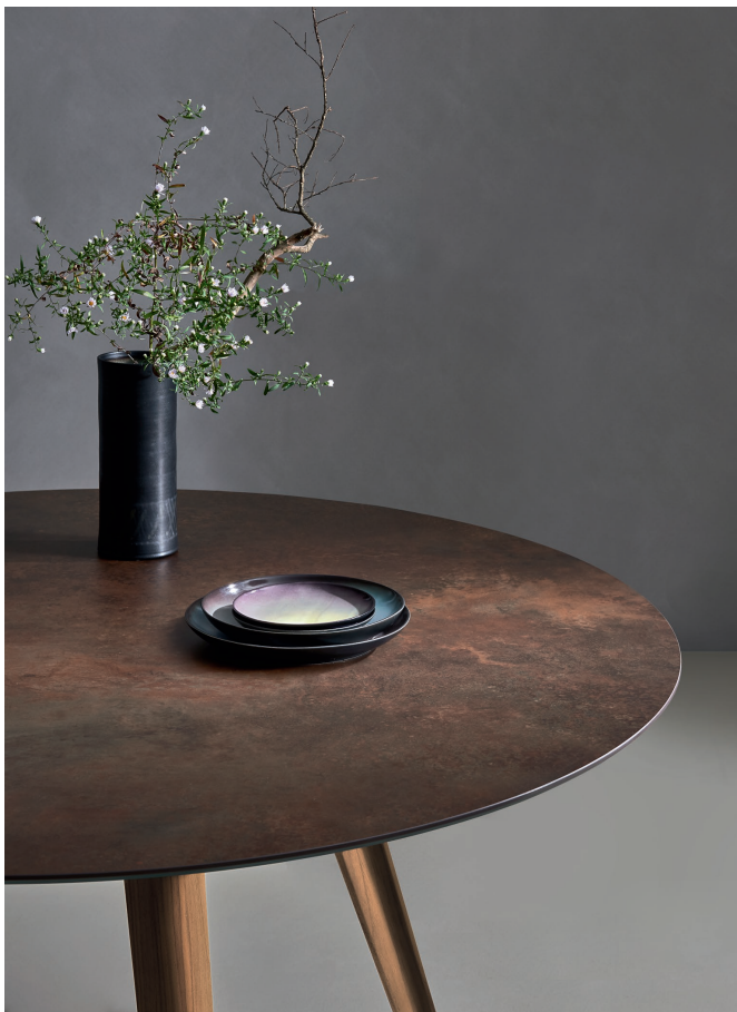
Tavolo Bistrot Ø 1300 x H 732

È adatto a molte situazioni diverse, sempre con una personalità inconfondibile, il tavolo Bistrot rotondo con piano da 1300 mm di diametro in finitura ceramica Ossido Bruno e gambe in frassino tinto Noce. Le gambe delle sedie Charlotte, con scocca rivestita in pelle Canapa, hanno la stessa particolare sagomatura di quelle del tavolo.